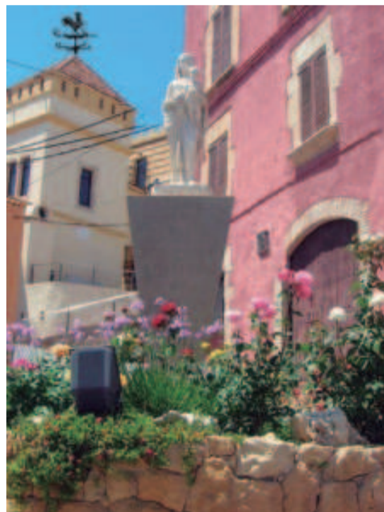
Les dues imatges d'Altafulla no són iguals. Troba les 7 diferències.