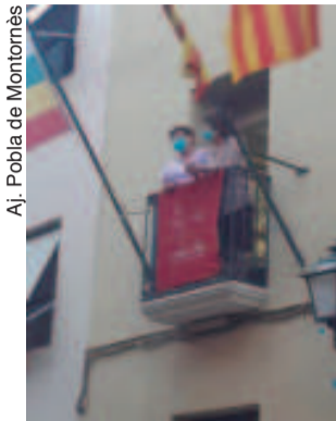
Aj. Poble de Montornès

El sorteig es farà el primer dia de la Festa Major, 7 de setembre a la tarda, abans de la lectura del pregó. Les persones escollides podran pujar al balcó durant el pregó i la traca que donaran el tret de sortida a la Festa Major i tindran, a més, localitats reservades en la resta d'actes, que tenen aforament limitat.