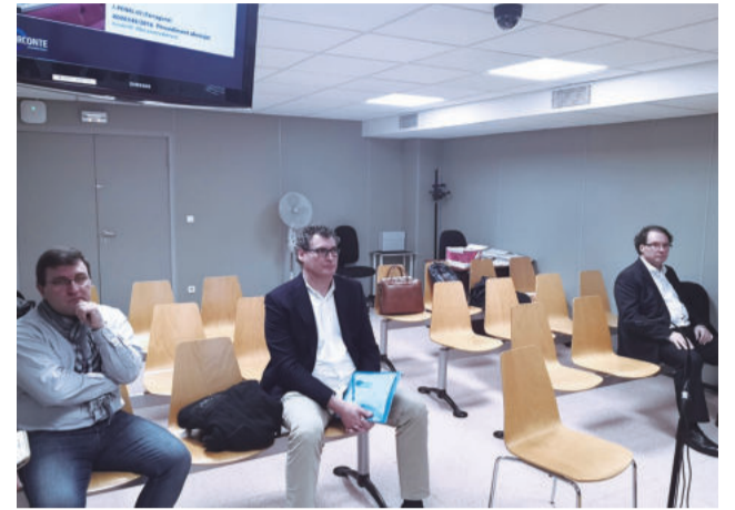
Moment del judici