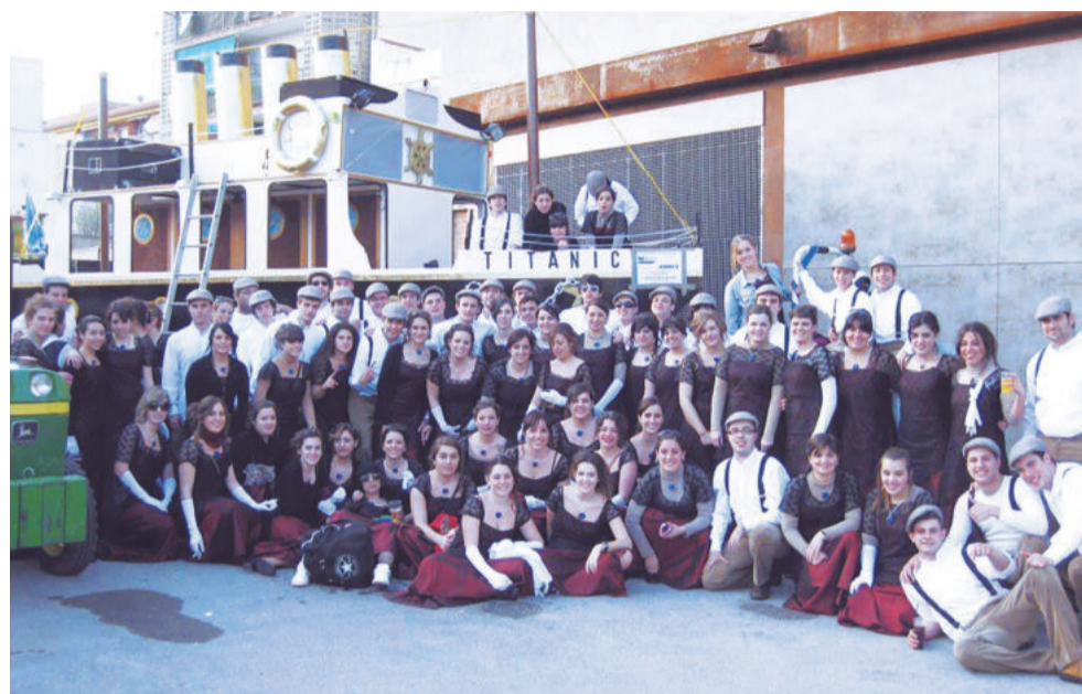
El primer premi de l'any 2012 va significar la consolidació de la colla.

que se n'encarreguen del tema de les disfresses i de les coreografies. A la Ferralla, les disfresses es compren fetes encara que sempre s'hi afegeixen elements per personalitzar-les. En 10 anys, però, també s'han fet ells mateixos les disfresses, han anat a una modista o un mixt de totes les opcions.