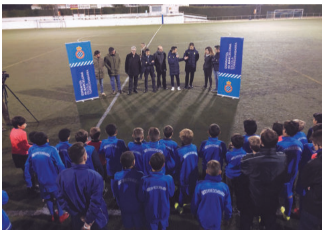
El Campus pot ser una gran oportunitat pels joves futbolistes de Torredembarra