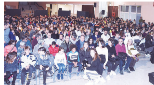
Moment de l'acte

barra, Associació de Vogadors de Baix a Mar, Club d'Escacs, Club Tennis, Club Patinatge Artístic, C.E Fitkidance, Bikepark Costa Daurada, Club Esportiu Rítmica, Club Natació Sincronitzada, Club Esportiu Beach Tennis, Club Pentatló, Associació Esportiva Dojo Zanshin, Club Esportiu Voleibol, Club Marítim T, Unió Esportiva Torredembarra i Club de Futbol Platja.