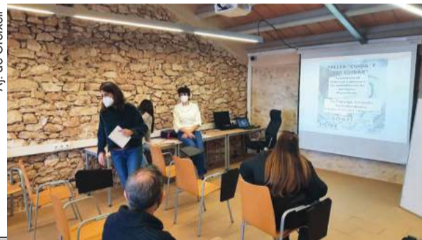
Aj. de Creixell

formació i de suport a les persones cuidadores no professionals que s'inclou dins del Pla Individual d'Atenció de la persona en situació de dependència. Aquest taller es desenvolupa des del Servei d'Orientació i Acompanyament a les Famílies (SOAF) i l'Àrea de Dependències i Gent Gran del Consell Comarcal del Tarragonès.