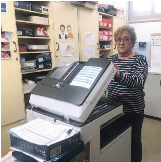
JG.- El Mònic

està guardada al magatzem. Ara tot es fa amb la fotocopiadora... aquesta part, tècnicament ha evolucionat molt.