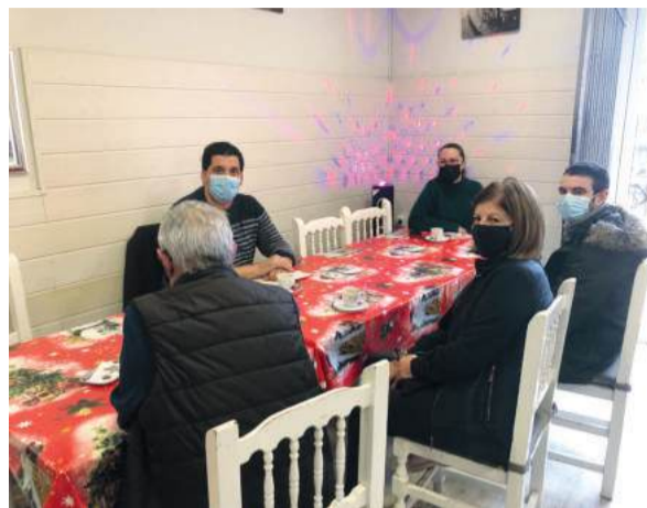
JG.- El Mònic

Aquest dissabte 27 de novembre es va fer per primera vegada i va ser molt profitós. En total s'hi van apuntar sis veïns i veïnes del mu-