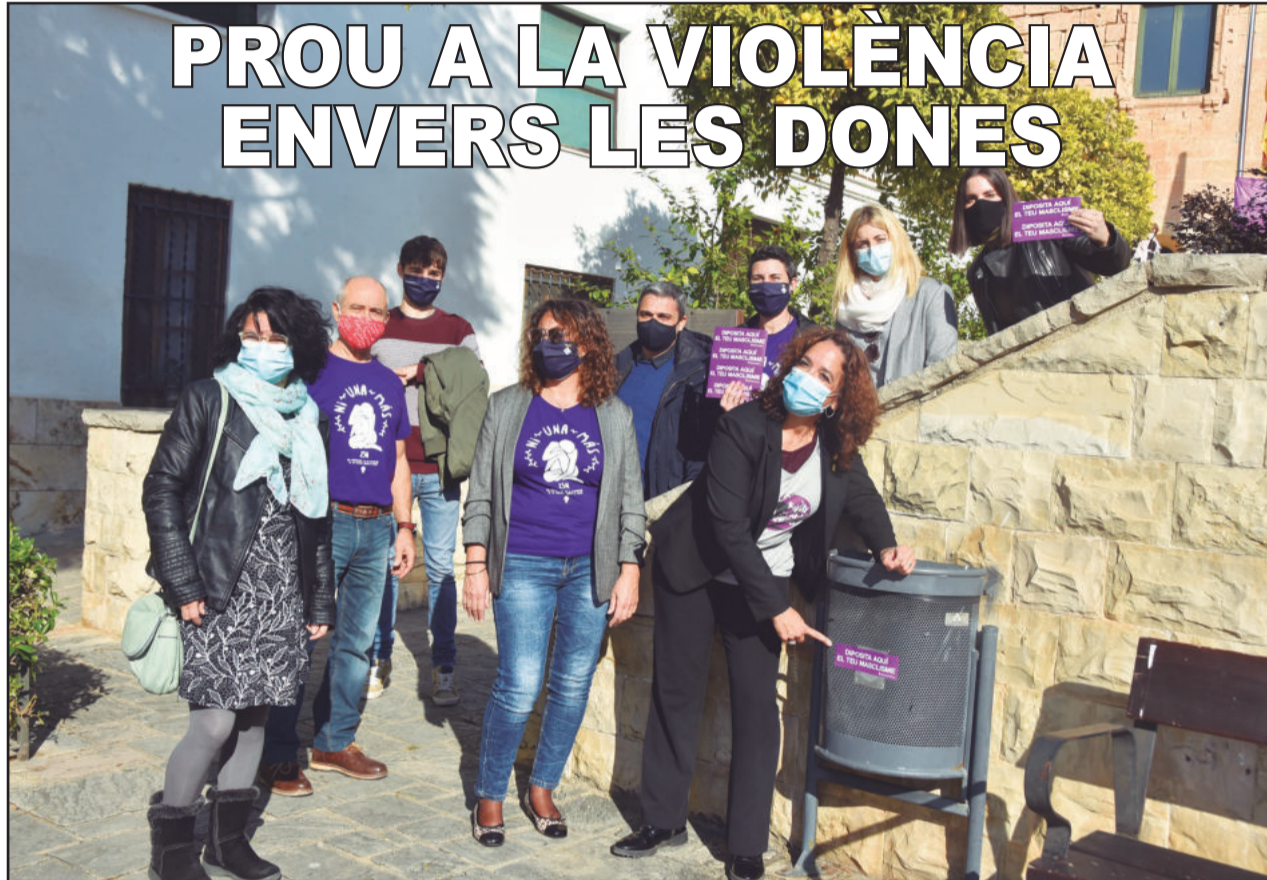
S'ha iniciat una campanya per combatre el masclisme i la violència de gènere