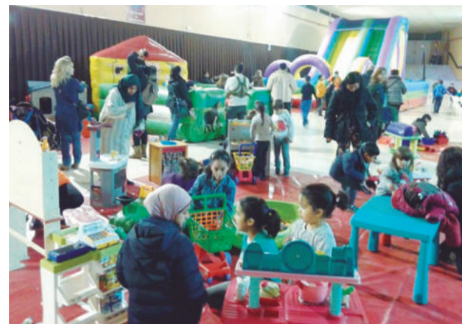
Edició anterior Casal de Nadal