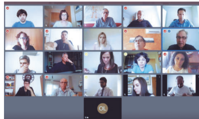
Per segona vegada el Ple serà telemàtic

• Establiments comercials i de serveis amb atenció al públic amb una superfície menor o igual a