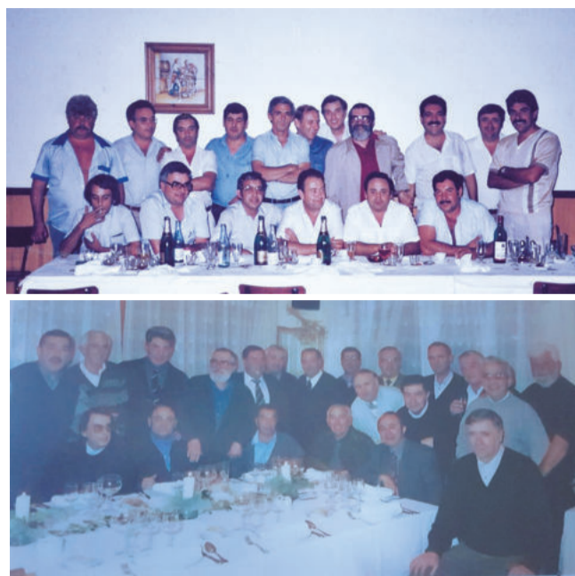
Foto de grup de la primera i última trobada.

Encara que la majoria van mantenir una relació, molts anys després, el 1984, per la Festa Major, es va decidir fer una trobada per recordar aquells temps preterits. En l'actu-