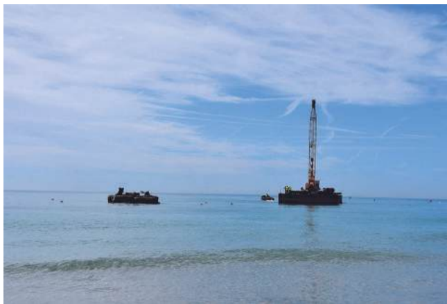
A l'esquerra de la imatge el Bloc, el dia que es va desmuntar l'Alfa i l'Omega.

Cal recordar que la funció inicial d'aquesta estructura anomenada el Bloc era la de servir com a punt de suport per a arrossegar les barques de pescadors tretes a la platja, i facilitar la seva sortida per a navegar. L'any 1999, l'Ajuntament de Torredembarra va instal·lar-hi una escultura d'acer de Rafael Bartolozzi, l'Alfa i Omega, que tenia una alçada total de 10 m, una amplada màxima de 4,8 m, i un pes estimat de 10 tones. Aquesta estructura va ser desmuntada el juny del 2018. Sobre el Bloc, actualment només hi ha uns pilons per a varar embarcacions. L'estat actual d'aquesta estructura és deficient, amb un impor-