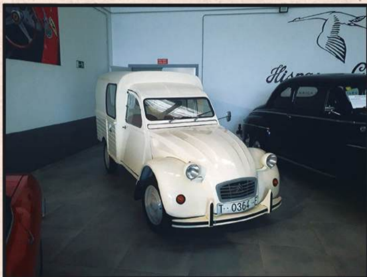
Especializados en la restauración de CITROËN 2 CABALLOS