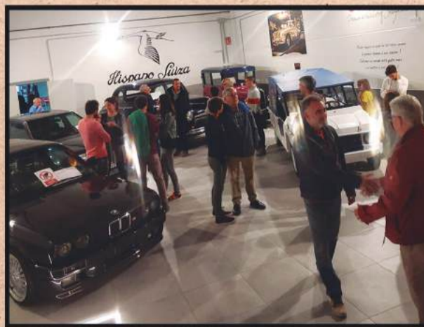
Trato personalizado y profesional, tenemos más de 20 años en Suiza

Exposición y taller en c/ Riera de Gaià, 22 (Pol. Ind. Roques Planes) Torredembarra