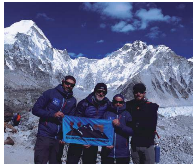
El Nepal, amb un sistema muntanyós on hi ha el pic més alt, està considerat com la gran fita dels excursionistes.