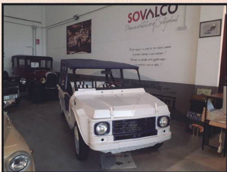
Trabajos de primera calidad con piezas de recambio originales

Exposición y taller en c/ Riera de Gaià, 22 (Pol. Ind. Roques Planes) Torredembarra