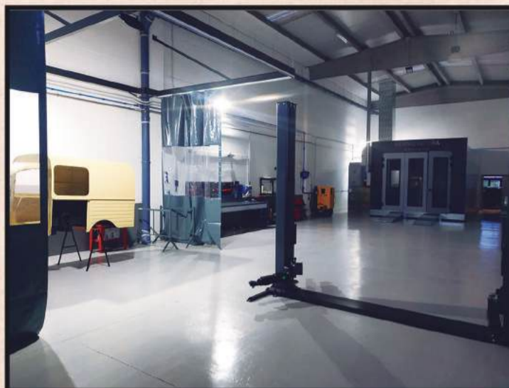
Taller con la última tecnología para la restauración de coches de alta gamma y clásicos