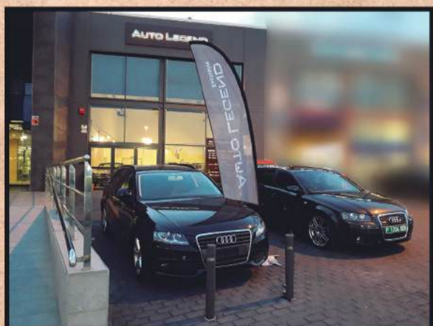
Coches clasicos y modernos