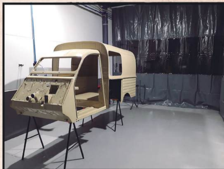
Recuperamos al 100% la chapa y la pintura, la dejamos como recién salida de fábrica