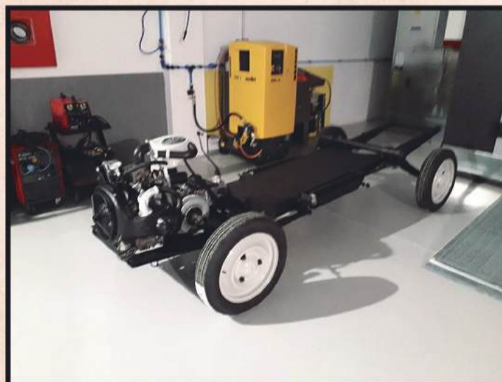
Trabajos exhaustivos. Reformamos los coches completamente con los mejores acabados