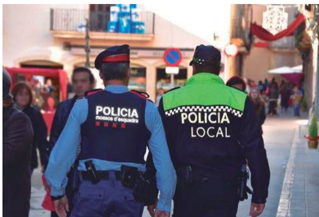
Ja fa anys que Mossos i Policia Local dissenyen un pla específic de vigilància per les dates de Nadal.

Aquest pla, vigent des del dia 13 de desembre i que finalitzarà el 7 de gener del 2020, té com a objectius principals garantir la seguretat de les persones en els seus desplaçaments i activitats i controlar i regular el trànsit de vehicles i vianants, restringint el trànsit de vehicles a determinades