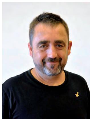
Imatge oficial del regidor