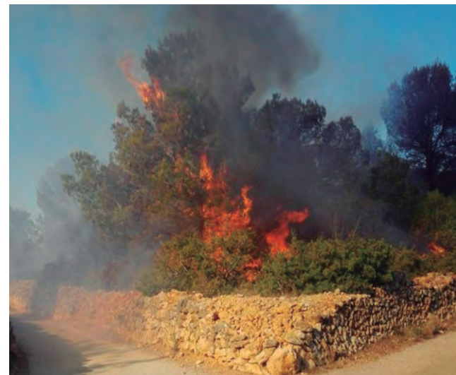
Incendi produït al camí del Moro el 14 de novembre

Sigui com sigui, els incendis més importats pel moment, han estat els provocats el passat 15 de desembre i que van afectar gairebé una hectàrea en una zona boscosa del carrer Àmfora, a la zona dels Munts. El primer es va declarar a les 13.15. A l'estar les flames molt a prop de la zona urbana hi van acudir cinc dotacions de Bombers, tres de la Policia Local de Torredembarra, dues d'Altafulla, una de Mossos d'Esquadra, així com també els agents rurals.