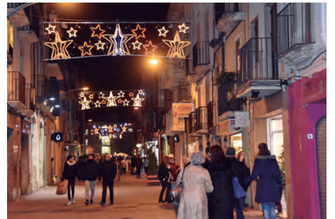
Ambient nadalenc a l'eix comercial

Finalment, la Policia Local recorda als ciutadans que la seguretat ha de començar en ells mateixos i per tant cal que prenguin les mesures de seguretat adients per evitar el risc de robatoris, furtos, accidents, etc... i que la conducció de vehicles requereix tota l'atenció que l'alcohol dificulta.