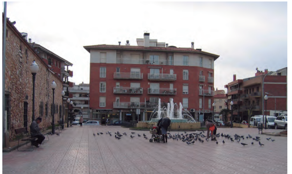
La plaça Mn. Joaquim Boronat és una de les més poblades

La Regidoria de Sostenibilitat informa que aquest 2017, des del gener i fins al mes de novembre, s'han capturat a Torredembarra un total de 334 coloms, bona part dels quals (96), amb les dues captures en xarxa dutes a terme els mesos d'octubre i novembre. La resta s'ha capturat al llarg de l'any amb les tres caixes-trampa que hi ha distribuïdes al municipi. La població de coloms augmenta als pobles i ciutats a l'hivern, que és quan en les zones rurals disminueix l'aliment. Cal tenir present que el cens de coloms realitzat l'any 2016 va determinar una població de 424 coloms, sent la plaça del Castell, la de la Vila i la de Mn. Joaquim Boronat les zones amb una densitat més elevada. Cal tenir present que la Regidoria de Sostenibilitat realitza el control de les plagues que puguin donar-se en el municipi i que siguin potencialment perjudicials per a la salut pública. En