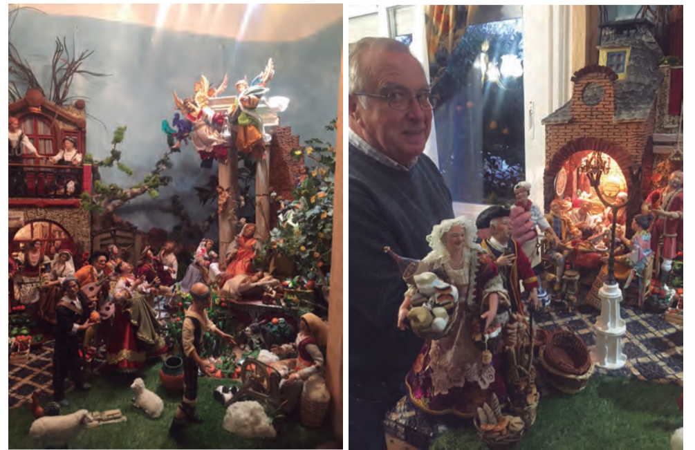
L'Agustín posa satisfet amb la creació pessebrística d'enguany

Amb un estil barroc, el naixement del nen Jesús es representa en les runes d'un antic temple romà. Per un cantó, perquè en aquella època s'havien descobert les ciutats de Pompeia i Herculà i el món romà