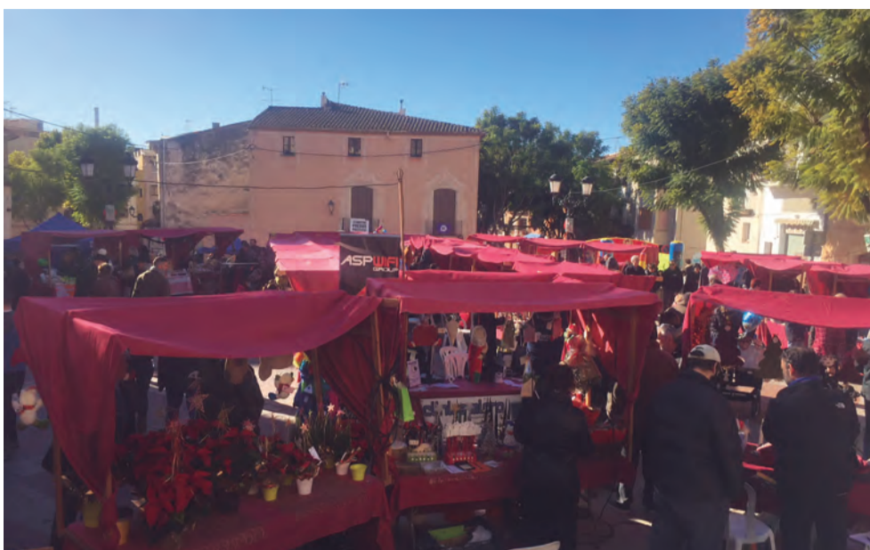
La plaça del Castell ha estat l'escenari de la Fira

Les botigues també tindran opció a premi, ja que els participants valoraran el "Millor aparador decorat de Nadal" i "L'objecte més original amagat a l'aparador". El sorteig es farà en un acte públic al Pati del Castell, el proper 4 de gener, a les 20.30 h.