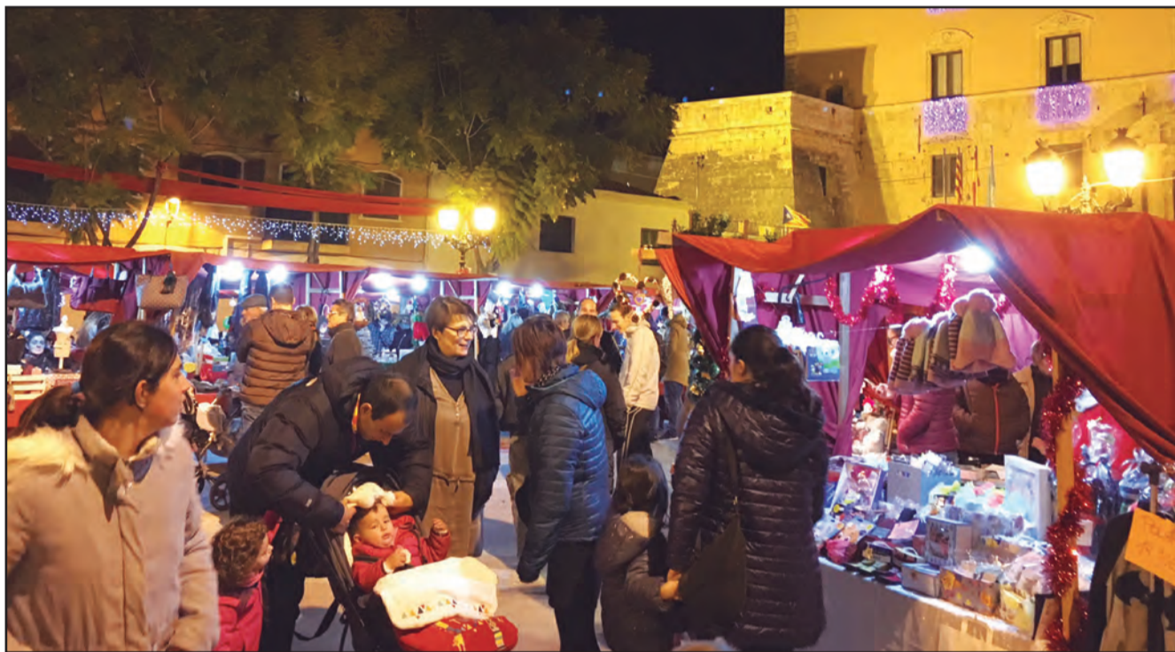
Per primer cop, la fira s'ha organitzat a la plaça del Castell.

Repàs de les activitats més importants d'aquestes festes tant emblemàtiques a la nostra vila. Reportatge sobre un pessebre singular. P2-4-5-6