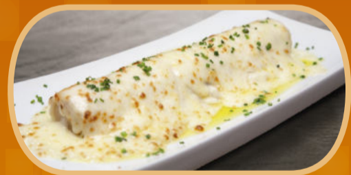
XXL de pollastre de corral o ceps. 4,90€/u.

Tel. 977 641 952 Passeig de Colom, 43. Torredembarra [Tarragona]