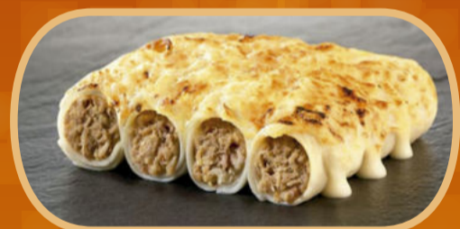
Carn o espinacs [mínim 5 u.]. 1,60€/u.

OXID us desitja bones festes i no deixis de demanar els nostres canelons a OXID HOME