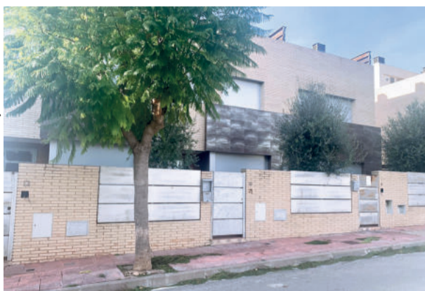
Aj. de Roda de Berà

L'adjudicació de cadascuna de les tres cases es realitzarà al participant que faci la proposta més avantatjosa per a l'Ajuntament, sobre un total de 100 punts. La meitat dels punts seran per a la millor oferta econòmi-